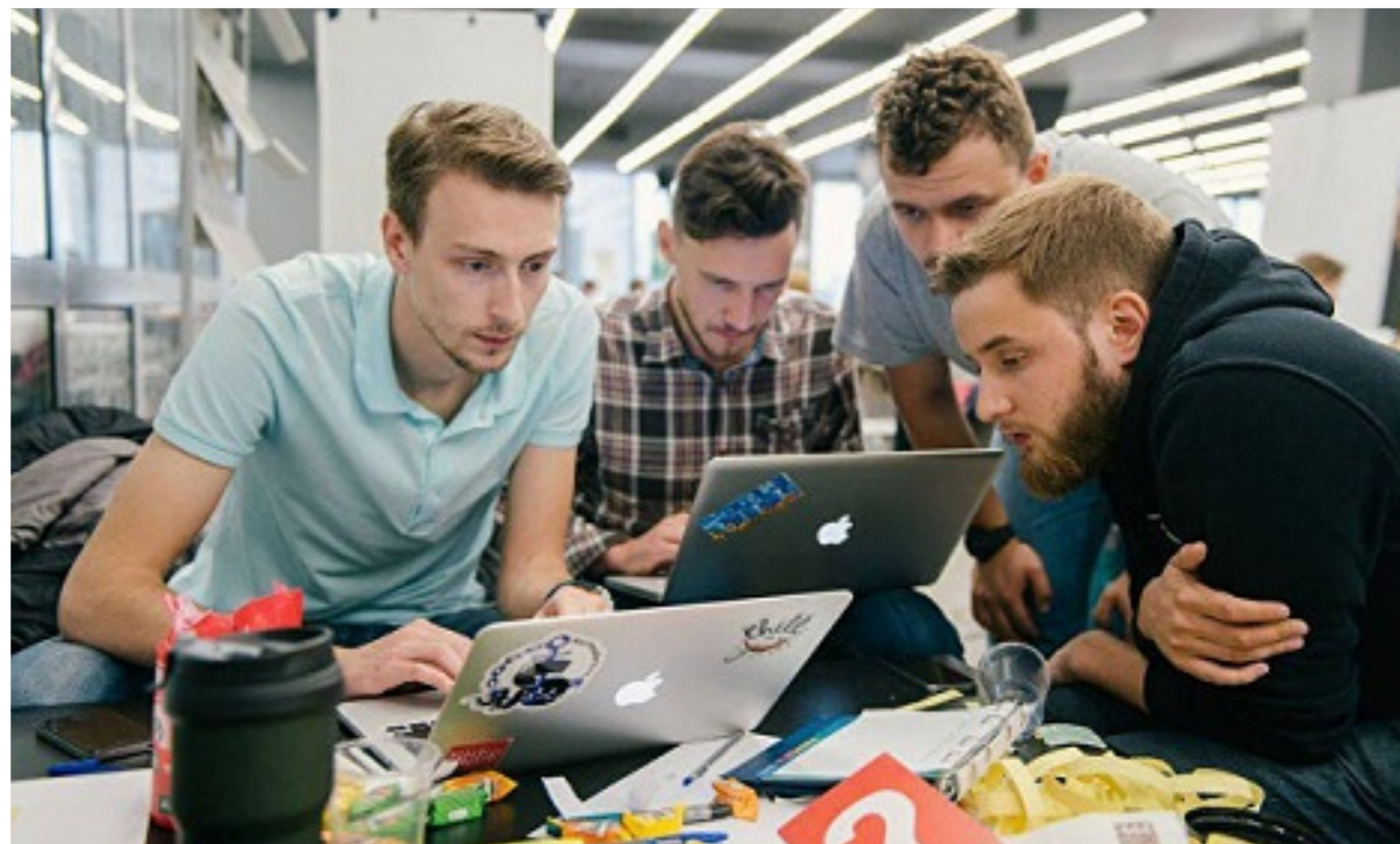
Как на самом деле