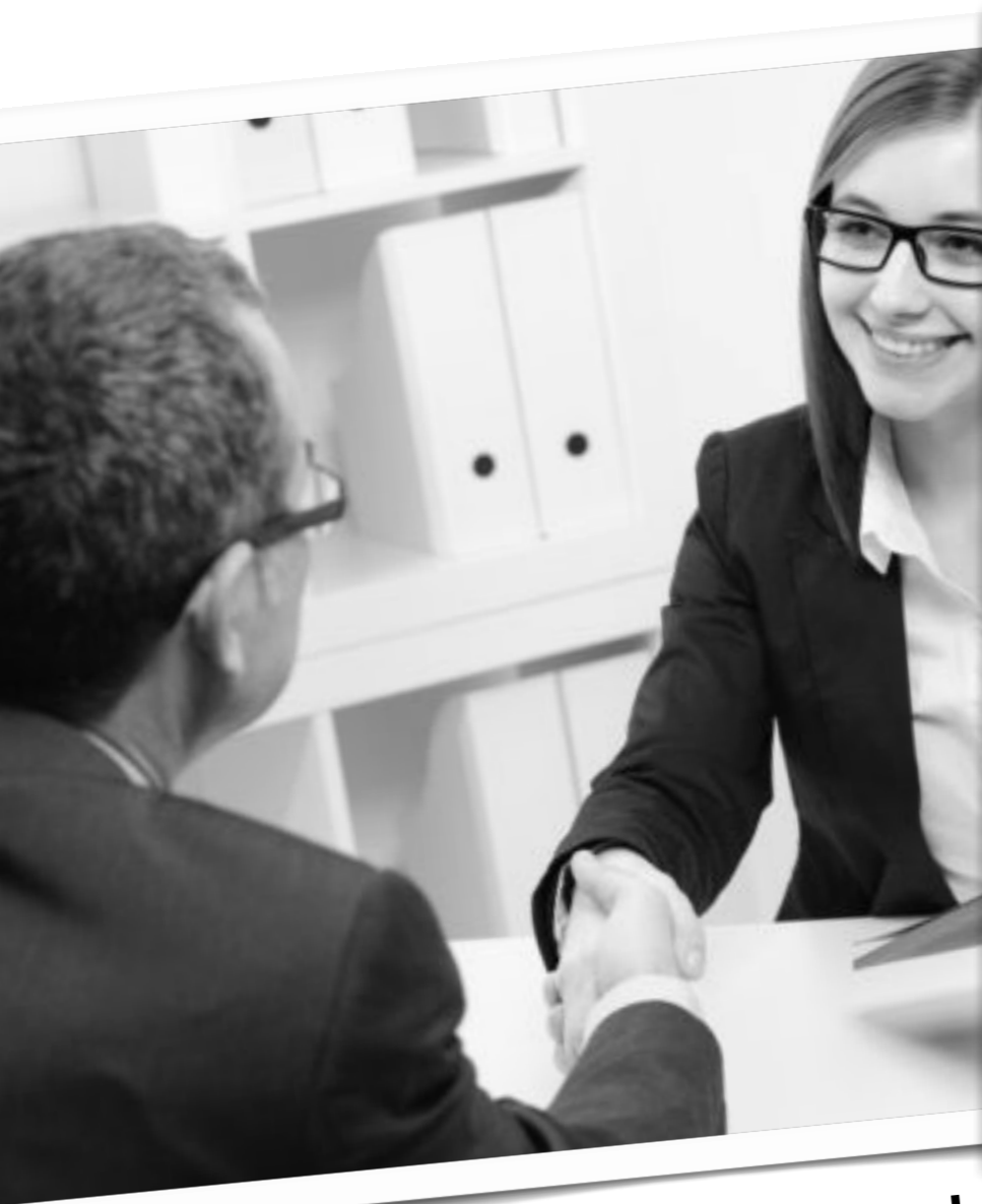
Как соискатели видят НН